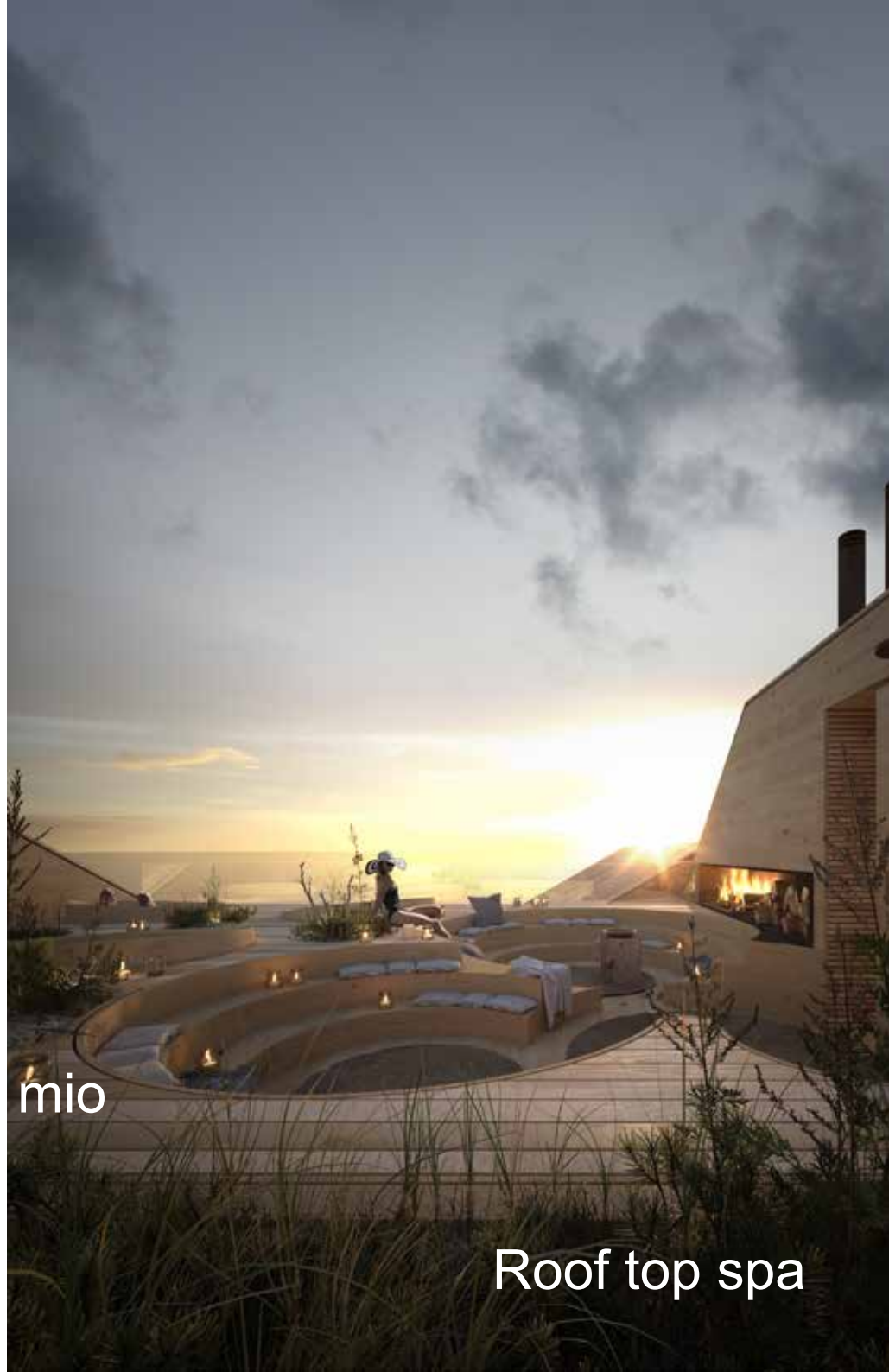
Roof top spa